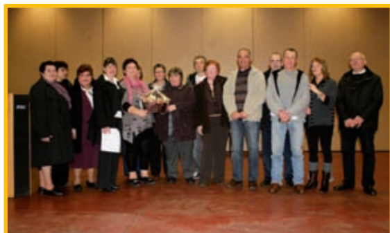
Les médaillés et les retraités 2010 parmi les employés de la mairie.