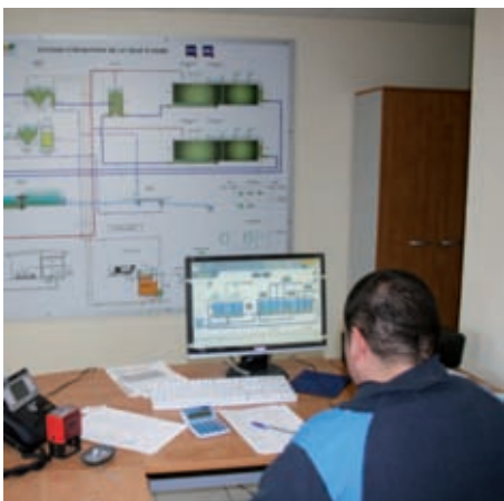
La station est gérée par un système informatique dernier cri

La station d'épuration reçoit les eaux usées. Elle les traite afin qu'elles puissent être rejetées sans danger pour l'environnement. La nouvelle station fonctionne selon un process du type "boues activées par aération prolongée" qui nécessite, entre autres, deux bassins d'aération et un bassin clarificateur. Après leur assèchement par centrifugation, les boues issues du traitement sont amenées sur une plate-forme de compostage qui entre dans la mise en valeur des déchets.