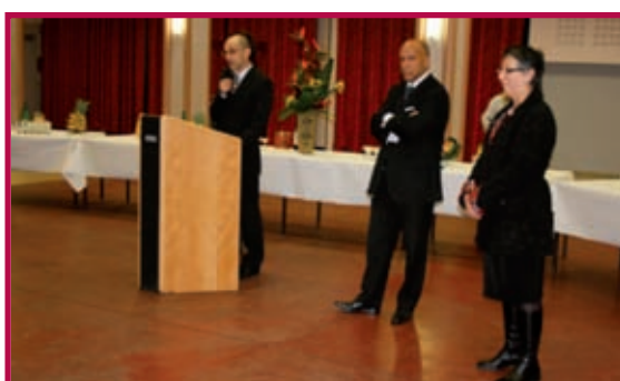
Le Sous-préfet présente ses vœux à la population.