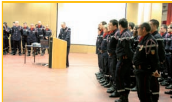
La Sainte-Barbe à la salle polyvalente.