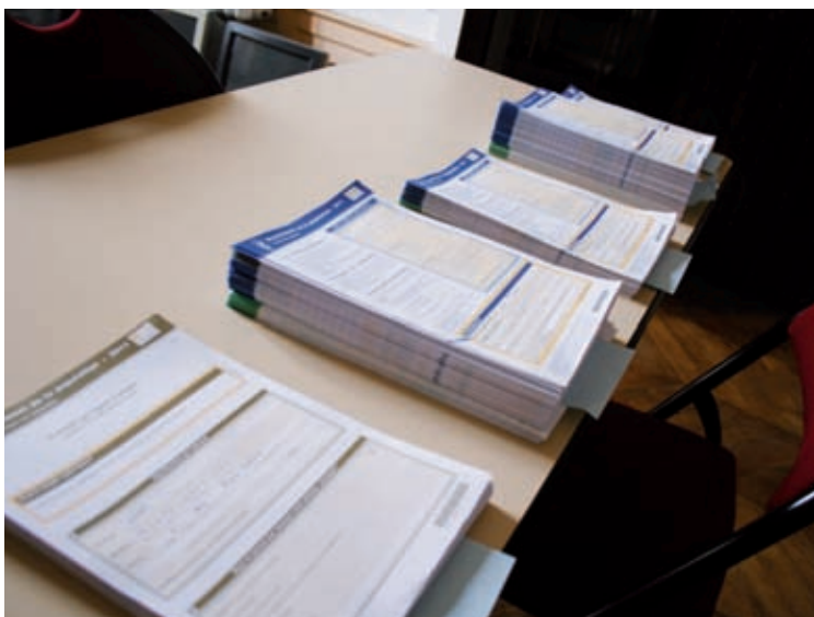
Les imprimés du recensement, une fois remplis sont stockés en mairie dans deux armoires. Ici, les fiches correspondantes à une semaine et demie d'enquête sur les cinq prévues.

112, c'est le nombre d'habitants comptés en plus sur la commune selon les résultats du recensement sur la période allant du 1 er janvier 2009 au 1 er janvier 2011. Dans le détail, en 2009, 10 752 Ussellois vivent ou ont une résidence sur le territoire, 10 812 en 2010 et 10 831 en 2011. Ces chiffres comprennent Saint-Dezéry et La Tourette.