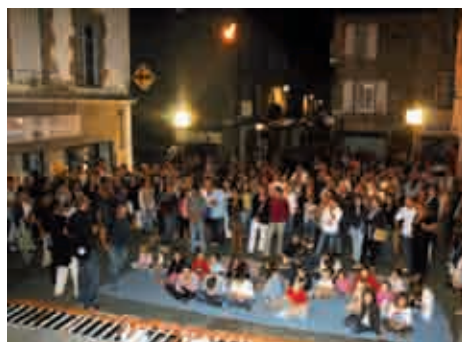
Le spectacle (2/3). 22h00. Le public qui assiste au spectacle de rue donné à l'occasion du film. L'assistance telle qu'elle est, les enfants au premier rang et les adultes en arrière, figurera dans le film.