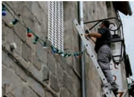
Le Décor (1/2). 10h00. Installation des guirlandes lumineuses rue de la Liberté, par le Syndicat de la Diège. Celles-ci donneront l'aspect festif correspondant à la scène tournée.

Merci à tous ceux qui ont rendu possible cette soirée hors du commun.