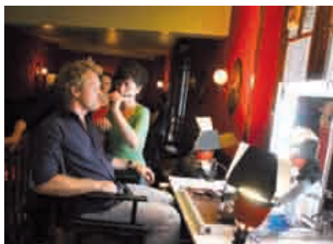
Les acteurs (1/2). 20h00. Les acteurs du film investissent un café de la ville pour faire de l'étage des loges improvisées. Avec eux, les maquilleuses et les habilleuses.