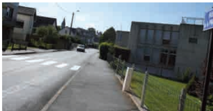
Rue de la Prairie (ci-dessus) et rue des Récollets (ci-dessous)