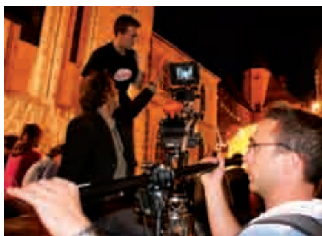
Le spectacle (1/3). 21h45. Le réalisateur assis derrière la caméra cherche le meilleur angle et la lumière la plus propice pour filmer le spectacle. A droite de l'image, le perchiste fait ses prises de son.