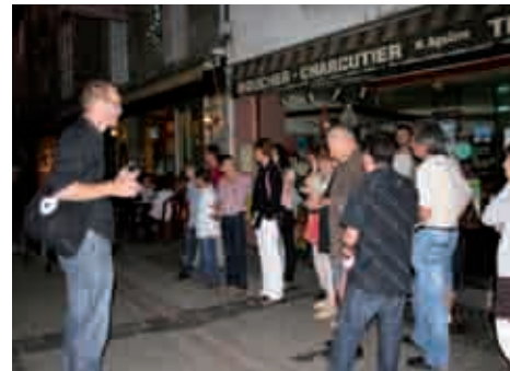
Les figurants. 21h00. Enfin, les ussellois "graines d'acteurs" entrent dans la course. Pour ces figurants de tous les âges, l'heure est venue d'endosser leur rôle de passants-joyeux-remontant-la-rue-de-la Liberté. Sur la photo, l'assistant réalisateur fait un petit briefing sur la marche à suivre. Plusieurs prises seront nécessaires.