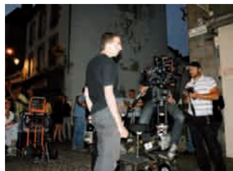
La caméra. 21h30. Les prises caméra des Ussellois remontant la rue pour se rendre au spectacle sont faites du haut de la rue de la Liberté.