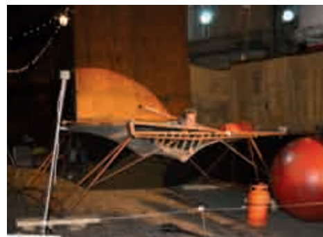
Le spectacle (3/3). 22h30. Une image du spectacle renversant "In Extremist". L'artiste n'hésite pas à jouer avec une bonbonne de gaz, à faire des bonds de plusieurs mètres de haut grâce à son trampoline géant et à marcher à l'horizontal. Crises de rire assurées.