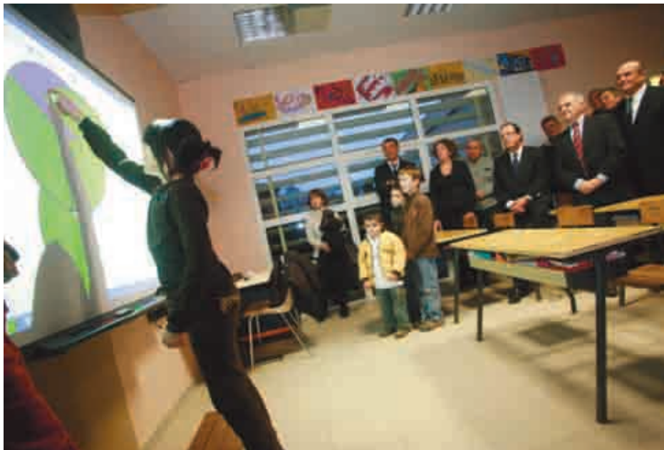
Un tableau blanc interactif qui réagit aux informations tactiles à l'école de Louignac.

Cet équipement s'inscrit dans le cadre du plan informatique de la Mairie, et vient compléter les 45 ordinateurs portables, acquis sur les fonds propres de la Mairie, et dont les écoles d'Ussel sont équipées depuis 2008.