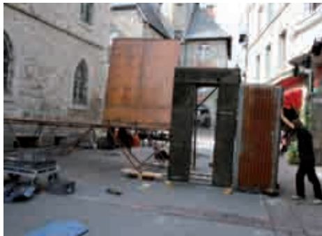
Le Décor (2/2). 16h00. L'équipe du spectacle "In Extremist" met en place le trampoline et les accessoires en haut de la rue de la Liberté.